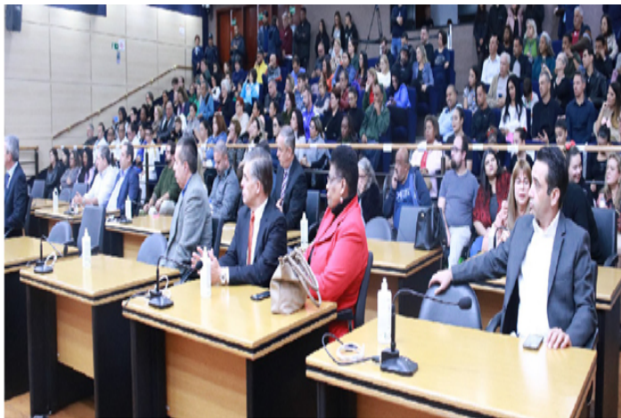
No evento, a Câmara entregou placas a pessoas portadoras de necessidades especiais, profissionais que trabalham em prol da causa e entidades que atendem PcDs