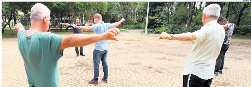
MUDANÇA: População idosa no Grande ABC deverá ser maioria em apenas dois anos, em relação às crianças menores de 14 anos; melhora na qualidade de vida e baixa taxa de fecundidade são algumas das causas