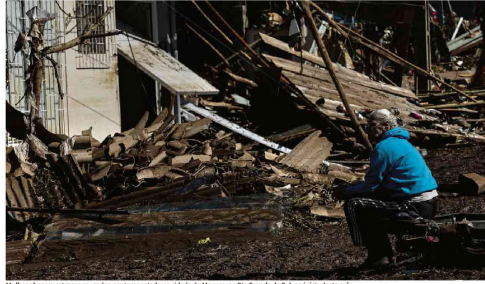
Mulher observa estragos causados por tempestade da cidade de Muquém, no Rio Grande do Sul, no início deste mês.