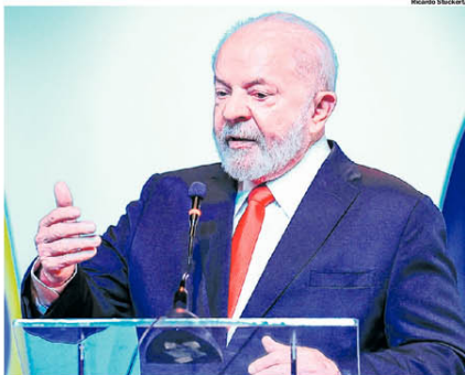
LULA. Terceira passagem do petista pelo governo federal ainda divide opiniões de eleitores