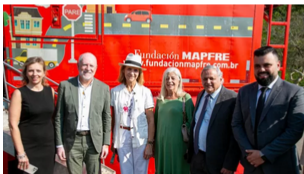
20092023 Visita da rainha da espanha (80)

realizada nesta quarta-feira (20/9), no Espaço Verde Chico Mendes.