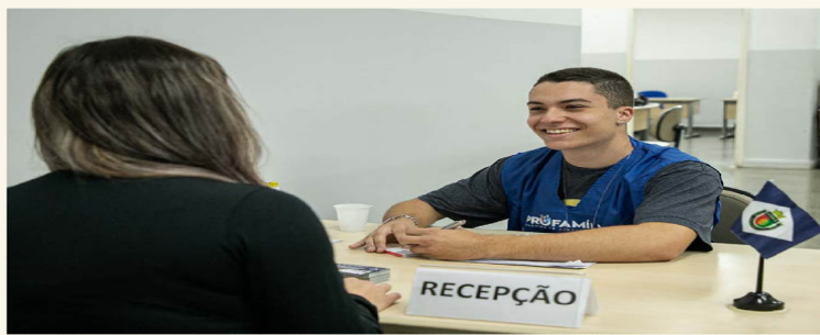
Os participantes do Programa Agente Jovem prestam serviços em departamentos públicos de São Caetano, recebendo uma bolsa-auxílio no valor de R$ 880,00 além de cesta básica

Oportunidades "Como programa, amplia as possibilidades de inclusão dos jovens no mercado de trabalho. Quanto mais capacitados, mais chances terão",