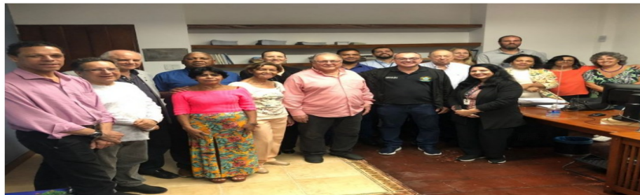
O CRS RJ inaugurou as novas instalações da Inspetoria Regional de Petrópolis na Rua Monsenhor Bacelar, no Centro, recebendo diretores, funcionários, inspetores, profissionais e empresários da cidade. A reforma e modernização oferecem maior conforto e melhor prestação de serviços aos profissionais da região.

Mesmo com a liminar do ministro Cristiano Zanin, do Supremo, favorável à prefeitura no caso da fatia maior do bolo do ICMS, ainda vale a pena um plano de contingenciamento que reveja e renegocie contratos, afinal, pelo que a gestão demonstrou, há desequilíbrio brabo das contas. Outra questão é a revisão de licitações futuras. As imprescindíveis terão de ser feitas, mas vai ser preciso é pé no chão para mensurar os gastos. E ainda tem o efeito cascata: o não pagamento ou atraso do fornecedor desestimula a participação deles e demais nas próximas concorrências e aí corremos o risco de ficar sem serviços.