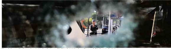
Marca de tiro em vídeo de carro de motorista de aplicativo que foi vítima de tentativa de assalto no av. do Estado, em junho deste ano