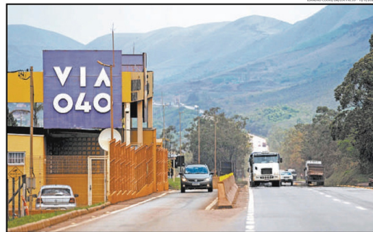
Posto da Via 040 na Grande BH: concessionária encerra operação em meio a indefinições sobre a manutenção e sem cumprir duplicações

Veículo: Impreso -> Jornal -> Jornal Estado de Minas - Belo Horizonte/MG