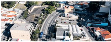
PASSADU. Avenida Maria Sardenha Demaretti em terreno em dois ângulos gerenciais de São Bernardo e região ao conectar ruas com os setores de gestão pública.

Ano eleitoral e divisor sobre repasse do ICMS explicam queda de 2%, em relação a 2023, nas receitas dos municípios.