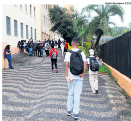
EDUCAÇÃO. Estudantes da região retomam a rotina nas salas de aula

Assim como o Estado, Santo André, com 42.539 alunos matriculados, e Diadema, com 30.366, também retomam o ano letivo nesta terça-feira. Mauá, com 17.880 estudantes, volta às atividades na última sexta-feira (21), já São Bernardo (80.000 estimados em janeiro deste ano), Ribeirão Pires (7.338) e Rio Grande da Serra (2.066) tiveram seu primeiro dia letivo do semestre nesta segunda-