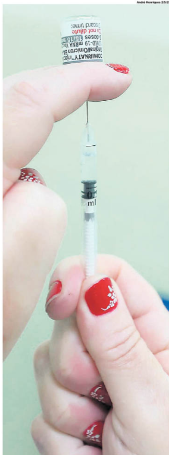
REFORÇO. Bivalente é composta pela cepa original e variantes da Covid

Entre os maiores de idade, pessoas com 18 a 29 anos correspondem a 9,6% dos imunizados no Grande ABC; todas as unidades de saúde disponibilizam a vacinação