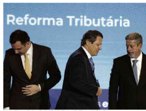
Os presidentes do Senado, Rodrigo Pacheco, e da Câmara, Arthur Lira, e o ministro da Fazenda, Fernando Haddad em Brasília.