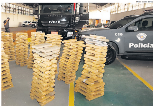
SÃO BERNARDO. Em 2020, a PM apreendeu 2,3 toneladas de entorpecentes, no bairro Cooperativa

A SSP destaca que as polícias utilizam abordagem multifacetada, envolvendo investigações, trabalho de inteligência, monitoramento geográfico e atuação em campo para combater o tráfico de drogas no Estado.