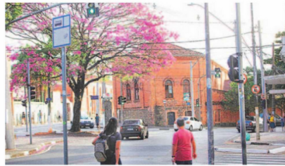
As negociações entre Prefeitura e Estado existem desde 2021; Cultura diz que conversas estão avançando

lação. Queremos justamente que sejam feitas contribuições para mandar à empresa que elaborou o projeto, para que ela possa fazer as devidas alterações, uma vez que não será mais possível mexer (no projeto) de-