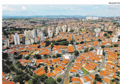
A Prefeitura de Campinas acredita que a população da cidade deverá continuar crescendo ao longo dos próximos anos e já projeta ações para atender as demandas futuras

Ao Correio Popular, a assessora técnica do IBGE informou que os próximos recortes do Censo, com dados sobre idade média da população, cor e religião, entre outros, devem ser divulgados nas próximas semanas, mas ainda não há uma data definida para que isso ocorra, de acordo com o Instituto.