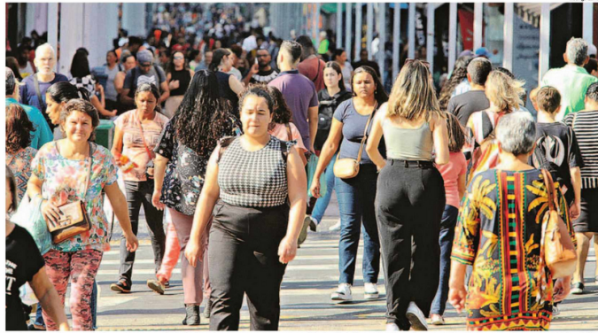
Desde o último Censo, realizado em 2010, a população de Campinas cresceu 5,4%, percentual abaixo do índice nacional, que ficou em 6,5%; cidade tem atualmente 501.852 domicílios

"As pessoas estão optando por morar em cidades no entorno das metrópoles, onde