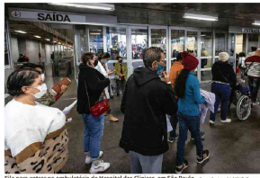
Fila para entrar no ambulatório do Hospital das Clínicas, em São Paulo.

Essa é uma boa notícia para o SUS brasileiro de cirurgias