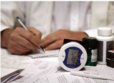
Médico preenche documentos de consulta

Após a aprovação do projeto de lei, o texto autoriza a criação de medidas de fiscalização para auxiliar em suas investigações.