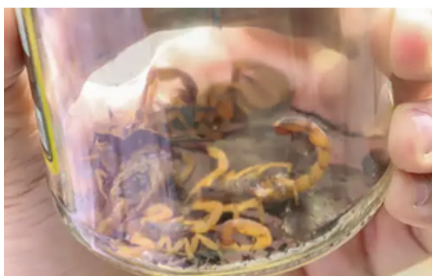
Caça aos escorpiões

Para envolver a população no tema, o CCZ tem intensificado as visitas às residências com dicas sobre como evitar a presença de escorpiões nas casas