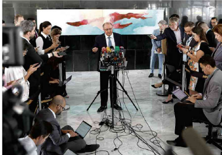
O vice-presidente Geraldo Alckmin (PSB) anuncia plano para incentivar compra de carros.