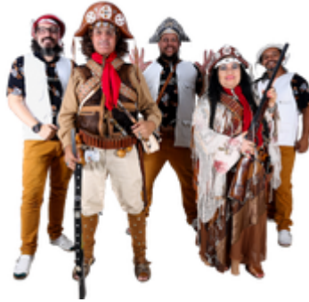
Trio da Lua + lampião e maria bonita