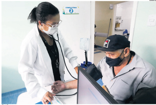
SUS. Médicos irão atuar na atenção primária nas unidades de saúde; Municípios da região já manifestaram interesse nas vagas.

mado pelas Prefeituras, cinco municípios manifestaram interesse em todas as vagas disponíveis – Rio Grande da Serra não informou se irá aderir ao programa. Mauá reforçou que caso tenha a possibilidade, irá “se mobilizar para conseguir até mais profissionais.”