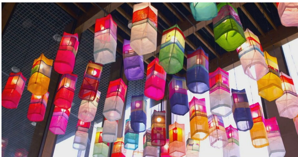
Obra no Centro Cultural Coreano