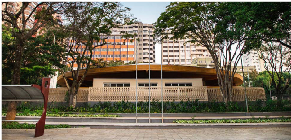
O projeto da EMEI Cleide Rosa Auricchio é modelo de sustentabilidade, que integra a unidade escolar à Praça Luiz Olinto Tortorello. O convívio com o espaço verde da praça, incluindo uma horta, é incorporado aos conteúdos pedagógicos da escola

O projeto arquitetônico da EMEI (Escola Municipal de Educação Infantil) Cleide Rosa Auricchio,