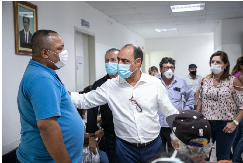
Prefeito José Auricchio Junior visitou uma das unidades de atendimento

A Prefeitura de São Caetano, por meio da Secretaria de Saúde, realizou no primeiro dia de ações do Governo em Movimento Bairro Nova Gerty 281 atendimentos em Urologia, Hematologia e Ortopedia, no Policlínico Gentil Rstom e nas unidades móveis de Oftalmologia, Odontologia e Clínico Geral que atenderam em livre demanda em diferentes pontos do bairro. No sábado (4/3) haverá atendimento em livre demanda, com clínica geral, consultas de telemedicina com agendamento e vacinação antirrábica para cães e gatos.