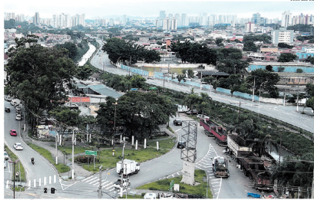
PREVISÃO. Governo projeta seis estações do Metrô na região: quatro em Sto. André e duas em S. Bernardo

Essa primeira etapa de estudo de desapropriação