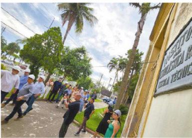
Comitê de autoridades percorreu o complexo arquitetônico da antiga escola. Deteriorados, espaços vão demandar tempo para restauração

No complexo há três imóveis tombados (prédio principal da frente, antiga casa do diretor e Capela de João Bosco) e cinco outros com níveis de proteção que exigem conservação da fachada e telhado. São 17 mil metros quadrados de área, dos quais 12 mil de área construída.