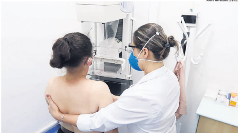
PREVENÇÃO. Exame de mamografia é a melhor forma de detectar precocemente o câncer de mama