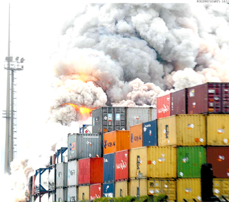
Incêndio na Localfrío em 2016: nova ferramenta promete agilizar contato para diversos tipos de ocorrência