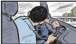
Na BR-116, altura do Km 792, próximo a Além Paraíba o motorista perdeu o controle da direção ao passar por uma ponte e saiu da pista comido de uma altura de 10m