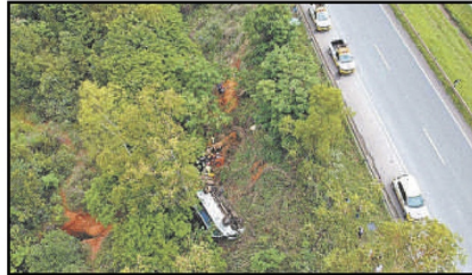
Na BR-040, micro-ônibus que transportava pacientes para consultas despencou de altura de seis metros, em Caetanópolis: três pessoas perderam a vida