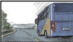
Um ônibus saiu de Ubaporanga (MG) com destino a Duque de Caxias (RJ). O veículo levava o time de futebol Esporte Clube Vila Maria Helena