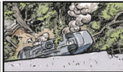
O ônibus caiu com o teto virado para baixo. Ficaram feridas 29 pessoas, quatro morreram: um adulto e três adolescentes

Veículo: Impreso -> Jornal -> Jornal Estado de Minas - Belo Horizonte/MG