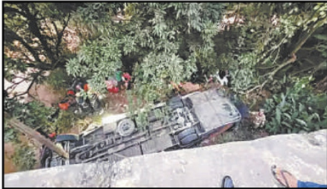
Em Além Paraíba, ônibus que levava equipe de futebol para Duque de Caxias perdeu o controle e caiu de ponte: três adolescentes e um adulto morreram

Sete pessoas morreram e 52 ficaram feridas ontem, em dois acidentes com ônibus nas BRs 116 e 040. No primeiro, as vítimas são jovens jogadores de futebol de Duque de Caxias, no Rio