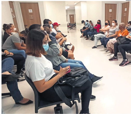
DEMANDA. Volume de pacientes com sintomas gripais em pronto atendimentos subiu 32% na região

A Prefeitura de Mauá informou que as UPAs da Vila Assis, Barão de Mauá, Magini e Zaira, além das UBSS Primavera, Magini, Zaira 1, Flórida e Feital são as unidades de referência para o coronavírus e síndrome gripal. Em Ribeirão Pires, os moradores podem recorrer à UPA Santa Luzia ou unidades da Atenção Básica.