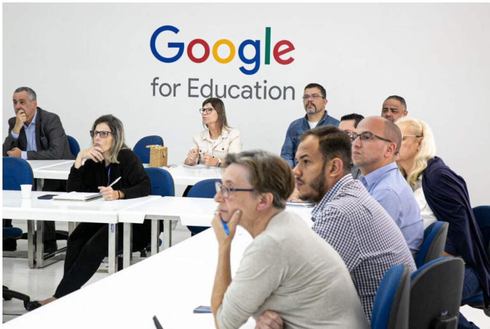
Prefeitura de São Caetano promove capacitação sobre repasses destinados ao Terceiro Setor

O propósito é garantir a execução de atividades ou de projetos de interesse público com a máxima eficiência, lisura e transparência.