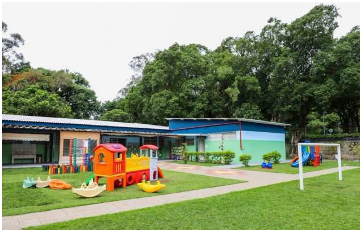
EMEI Irineu da Silva

A pré-inscrição será online, a partir das 9 horas do dia 06/12