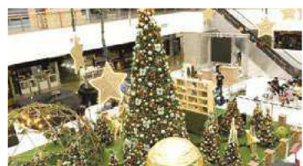
O Shopping Balneário tem como tema o "Natal da União". A decoração possui elementos interativos