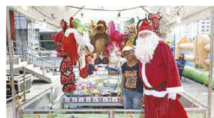
Para quem gosta de festa de rua, a tradicional festa natalina do bairro de Moema é a opção