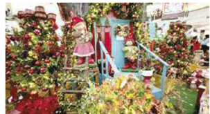
No Praiaomar Shopping o ponto de destaque será a famosa árvore de Natal, que estará no vão central do Shopping