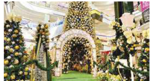
O Brisamar Shopping caprichou na decoração, fugindo do vermelho e apostando na elegância do dourado