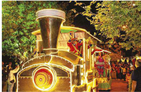
O Natal dos Sonhos da cidade de Campos do Jordão, no interior paulista, conta com diversas atrações para turistas e moradores

Quando: até 23 de dezembro. De quinta a domingo, incluindo feriados e vésperas em qualquer dia da semana, com duração de 2 horas cada sessão Quanto: a partir de R$ 125 por pessoa, inclui um combo com escolha de 1 prato/lanche e 1 sobremesa.