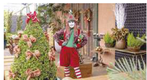
Em Holambra, evento terá Papai Noel, shows musicais, apresentações artísticas, bandas, teatro, dança típica