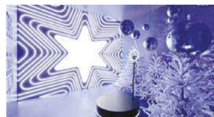
Para quem gosta de uma boa foto para postar nas redes sociais, a Casa das Sensações da Brasil Cacau é escolha certa