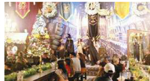
Natal Mágico Magia & Bruxaria. Além da decoração natalina, há pocket show com fadas, bruxos e elfos

Onde: Avenida Doutor Arnaldo, 1860 - Sumaré