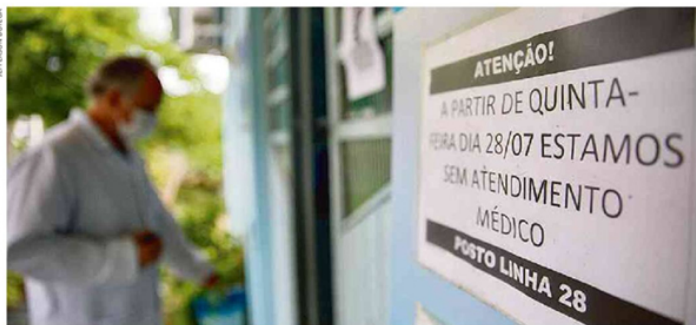
Cartz em unidade básica de Três Coroas, no Vale do Paranhana, mostra dificuldade enfrentada nos municípios