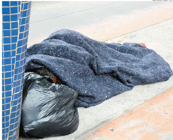
Outras metas consistem na erradicação da pobreza e na redução das desigualdades em todo o mundo