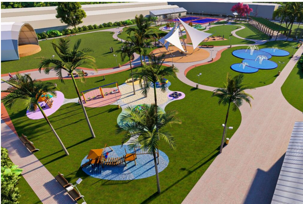
Prefeitura de São Caetano publica edital para a construção do Parque Tamoyo – Imagens em perspectiva

A área de intervenção é de aproximadamente 16 mil m 2 , oriunda da demolição de antigo centro esportivo recreativo municipal (Rua São Paulo, nº 200, no limite entre os bairros Cerâmica e Santo Antônio), cuja construção datava da década de 1960, e apresentava diversas patologias insanáveis, quando foi inutilizado, em 2020. O Parque Tamoyo terá ligação direta com o Parque Tom Jobim (inaugurado em 2018, com 14 mil m 2 ), perfazendo um total de 30 mil m 2 .