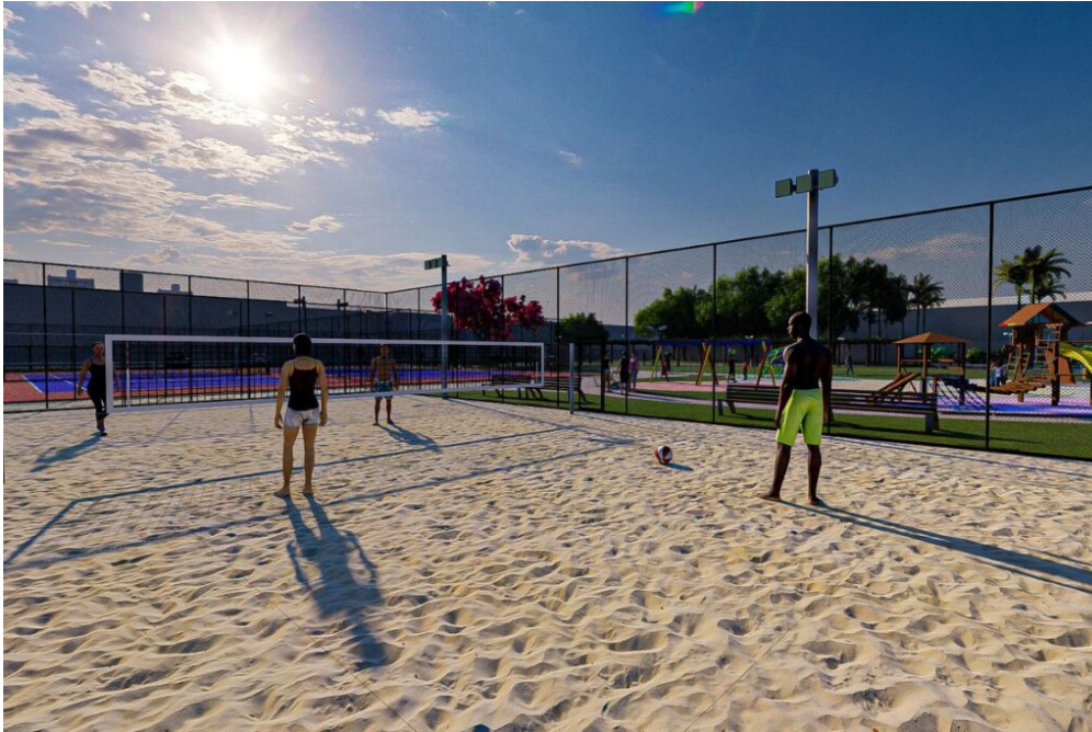
Prefeitura de São Caetano publica edital para a construção do Parque Tamoyo – Imagens em perspectiva

convivência, bicicletários, playgrounds, equipamentos de ginástica, iluminação pública, mobiliário urbano para conforto durante a permanência do usuário, palco para pequenas apresentações artísticas e espelho d'água.