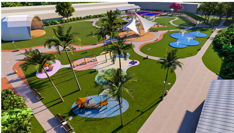
Imagens em perspectiva

São Caetano do Sul vai ganhar, em primeiro lugar, o Parque Tamoyo, o nono da cidade.