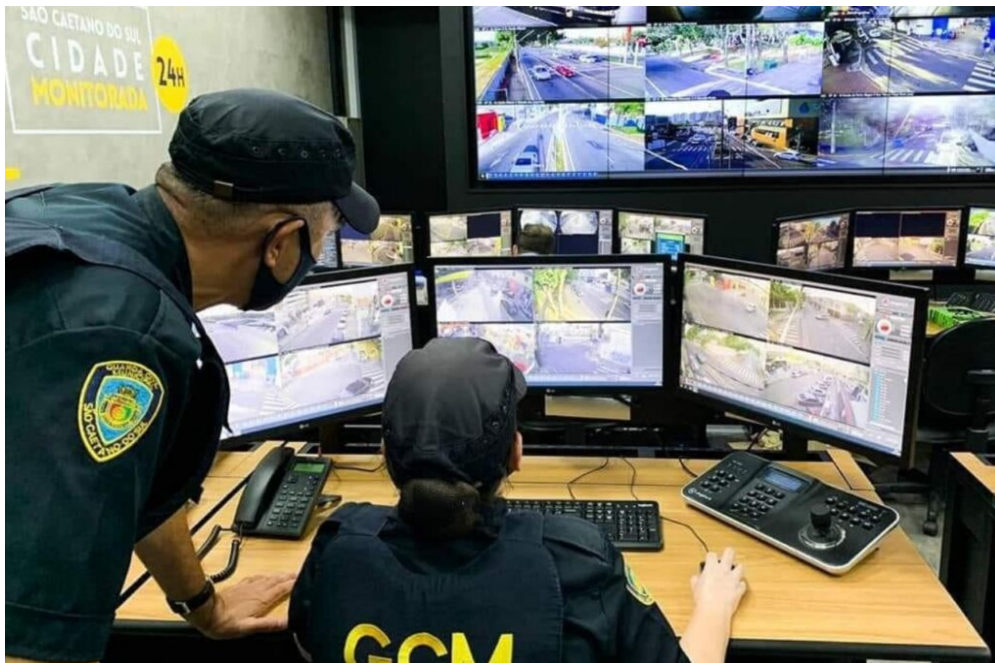
CGE de São Caetano ultrapassa 114 mil atendimentos

Considerado os olhos de São Caetano do Sul, o CGE (Centro de Gerenciamento de Emergências) ultrapassou a marca dos 114 mil atendimentos nas áreas de Segurança, Saúde, Defesa Civil e Trânsito, desde sua inauguração em agosto de 2020.