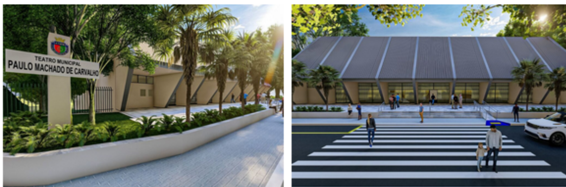
Prefeitura de São Caetano lança edital para reforma geral do Teatro Paulo Machado de Carvalho – Foto: Divulgação

Além disso, estão previstas adequações gerais, como novos sanitários de acesso público, reforma completa do foyer, requalificação da sala técnica de comando, modernização dos sistemas de encaminhamentos de sinais e energia, camarins e acessos à coxia e ao palco, reforma da bilheteria, construção de novo reservatório de água, recuperação dos elementos de fachada em metal e acrílico, novo paisagismo, novos gradis de fechamento, reparos na rede de hidrantes e instalação de equipamentos para a obtenção do AVCB.