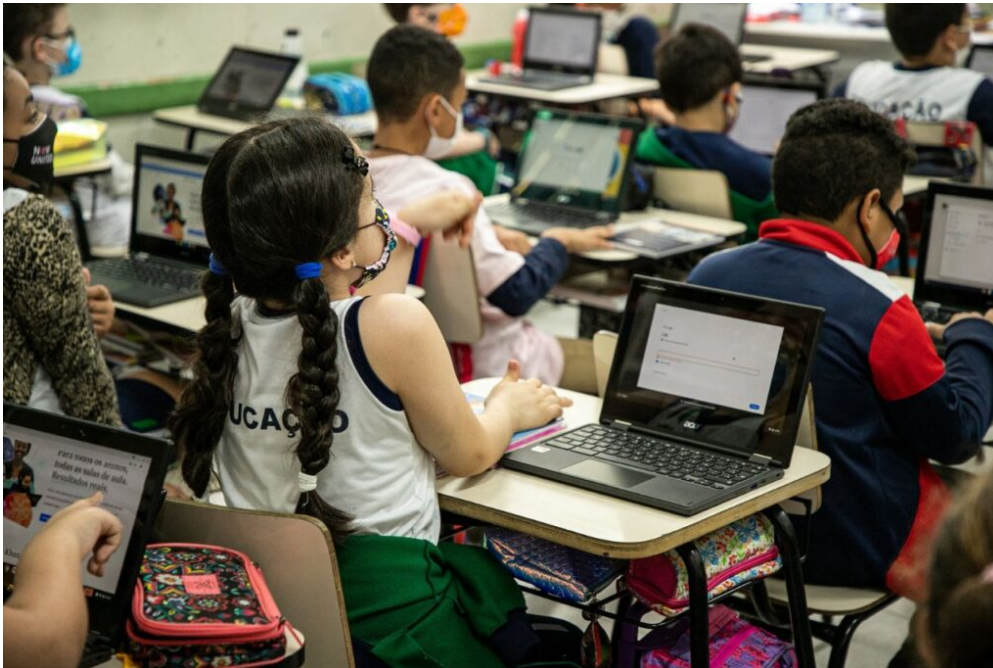
Anatel libera ativação de sinal 5G em São Caetano