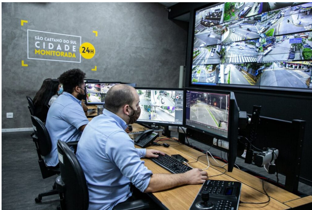
Anatel libera ativação de sinal 5G em São Caetano

O processo para tornar São Caetano uma cidade cada vez mais conectada começou em 2017, com a integração dos 152 prédios públicos, por meio de 200 quilômetros de fibra óptica. Essa mesma malha de fibra serviu para que, em 2020, a Administração disponibilizasse à cidade um sistema de monitoramento de vias públicas com mais de 300 pontos monitorados, o que culminou com a criação do CGE (Centro de Gerenciamento de Emergências).