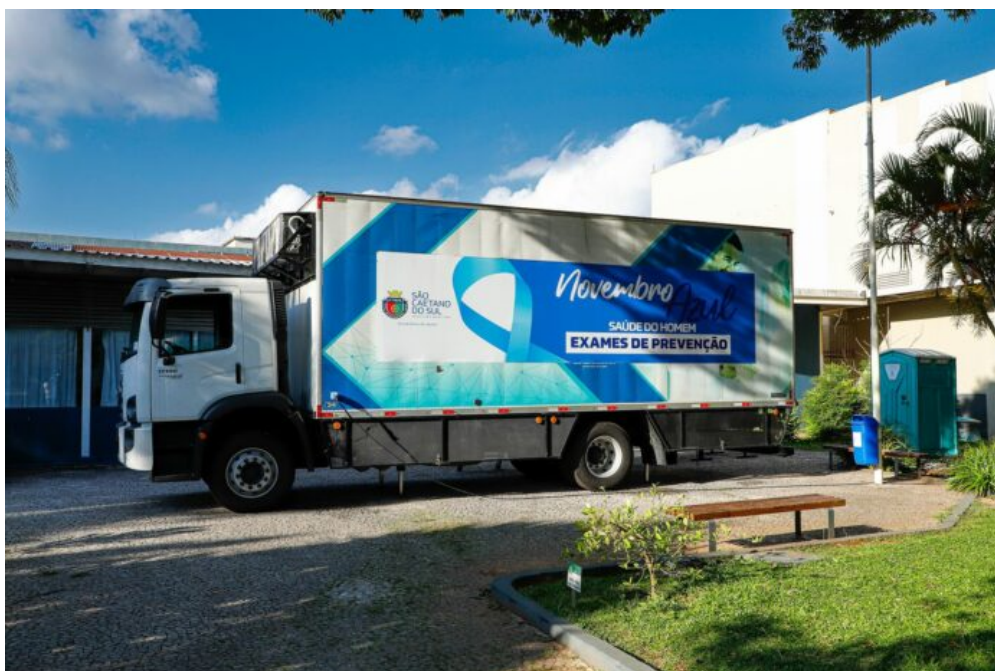
Carreta Móvel da Saúde de São Caetano

A Carreta Móvel da Saúde, de São Caetano, já realizou 1.002 exames e consultas. Até o dia 30 de novembro serão feitos atendimentos aos homens em conscientização ao Novembro Azul, mês de prevenção ao câncer de próstata. O funcionamento é de segunda a sexta-feira, das 8h às 17h, e aos sábados, das 8h às 13h.